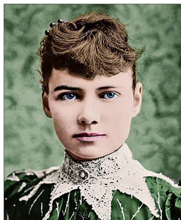
Nellie Bly.

ÉDITION Les reportages de Nellie Bly enfin édités en France