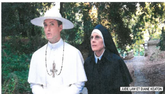
JUDE LAW ET DIANE KEATON

The Young Pope de Paolo Sorrentino avec Jude Law, Diane Keaton, Javier Camara, 10 x 52 min, deux épisodes tous les lundis à 20h55 sur C+.